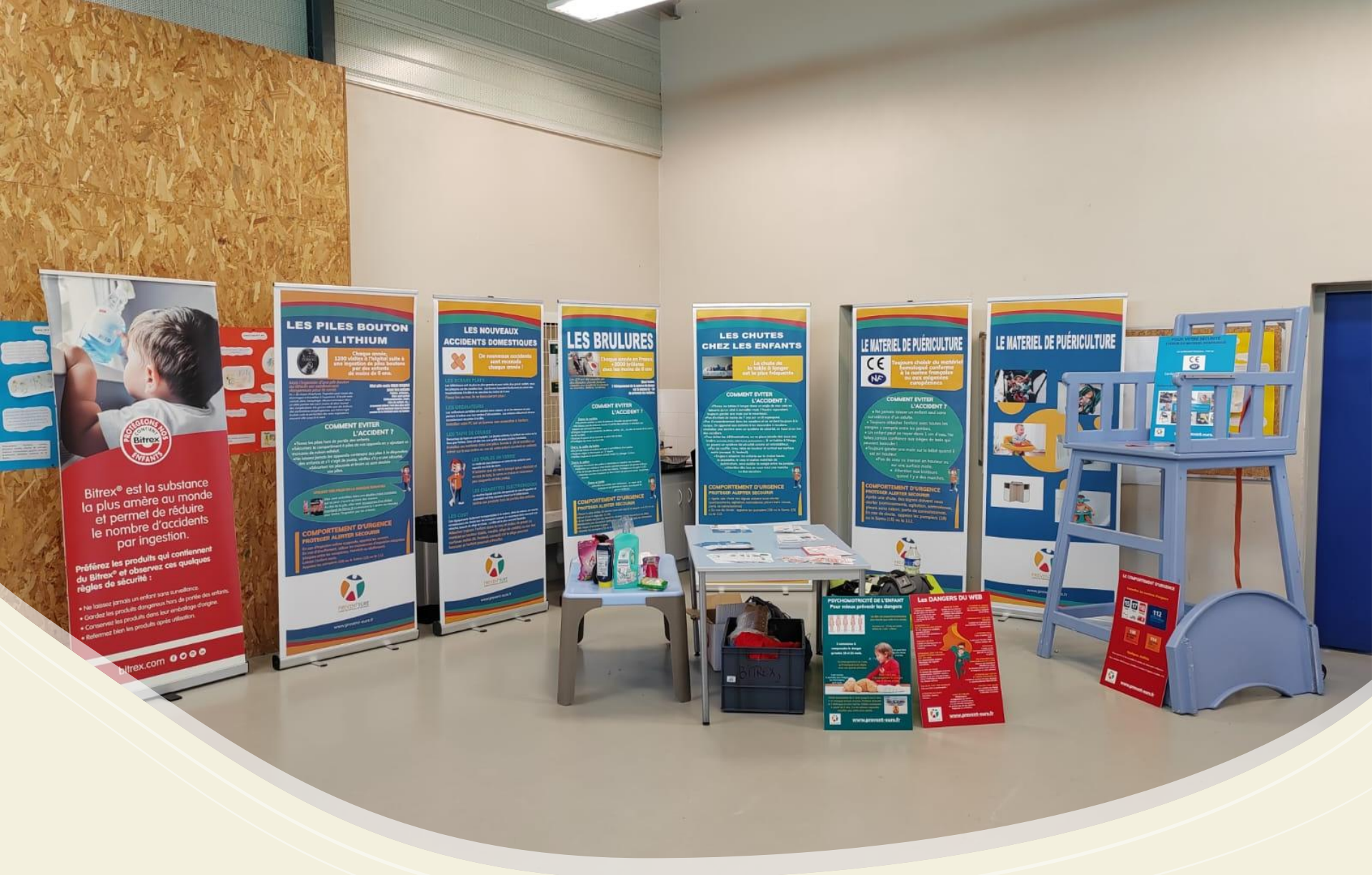
Animation complétée par une exposition de kakémonos