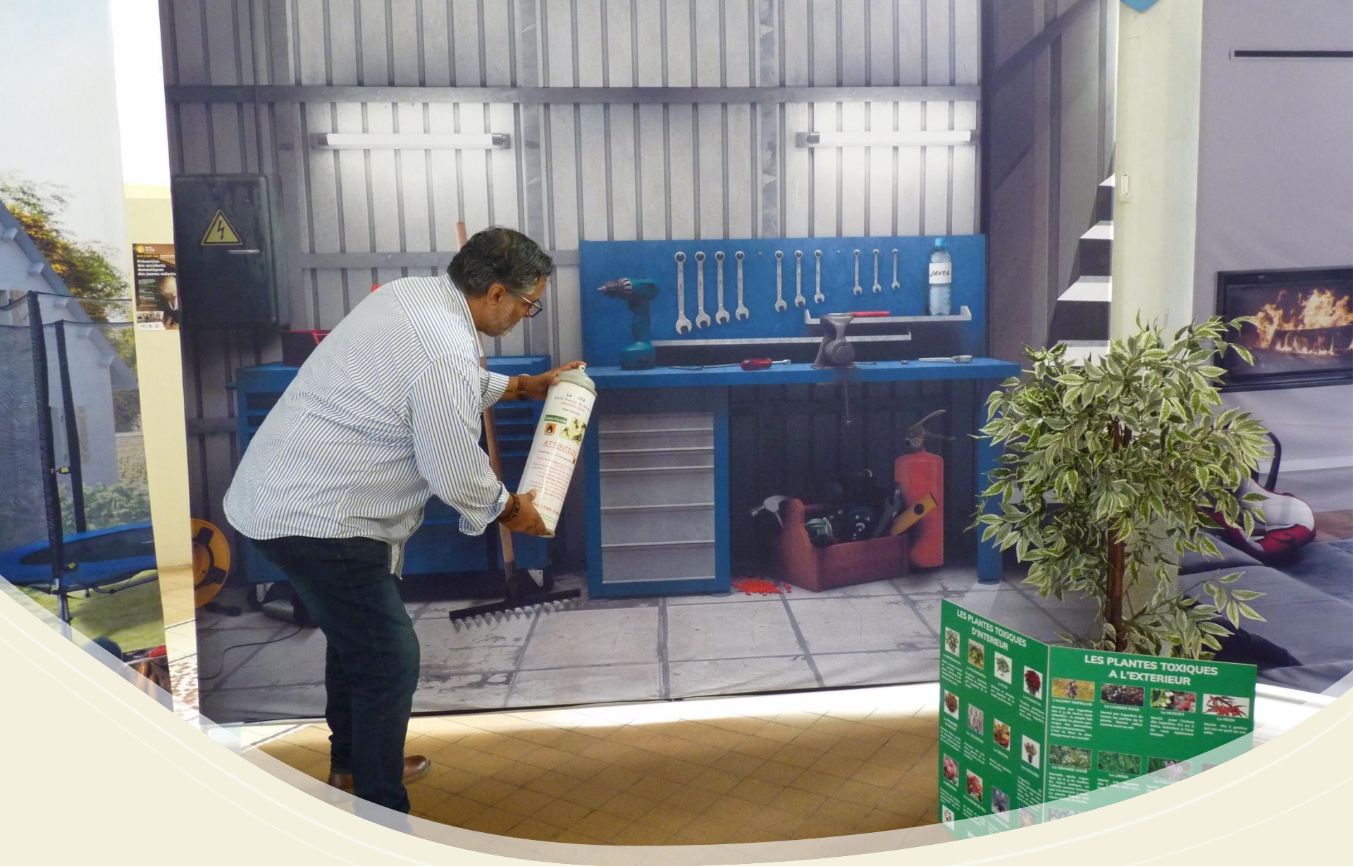
Le garage et les accidents de bricolage (option dangers du bricolage)