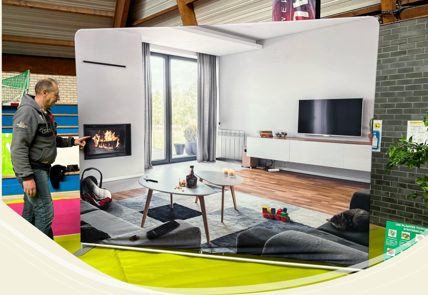
Le décor du salon