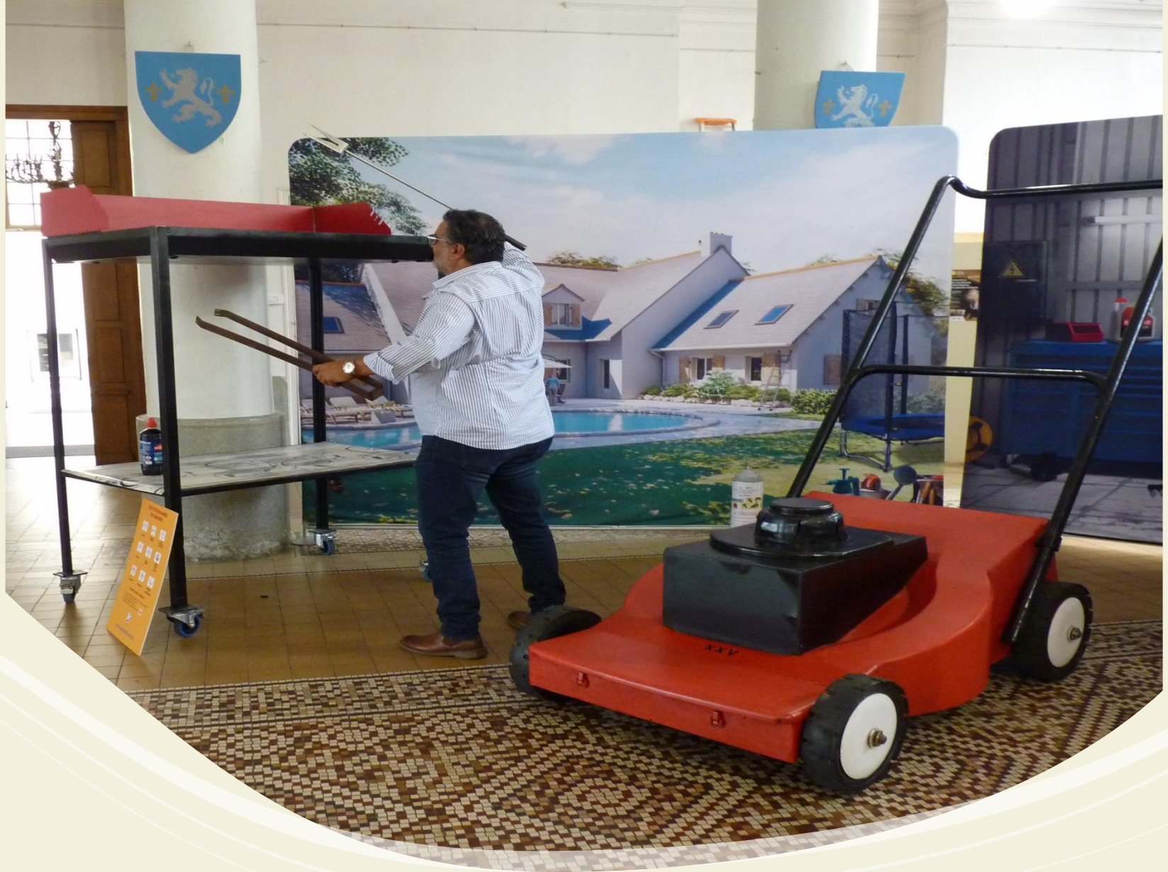
Les accessoires du barbecue