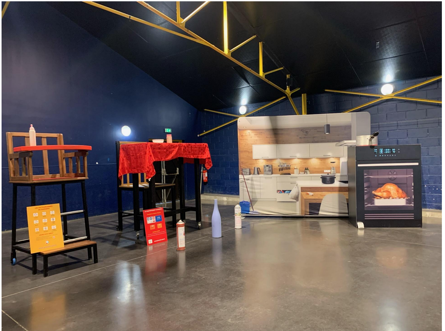
Le mobilier de la version soft