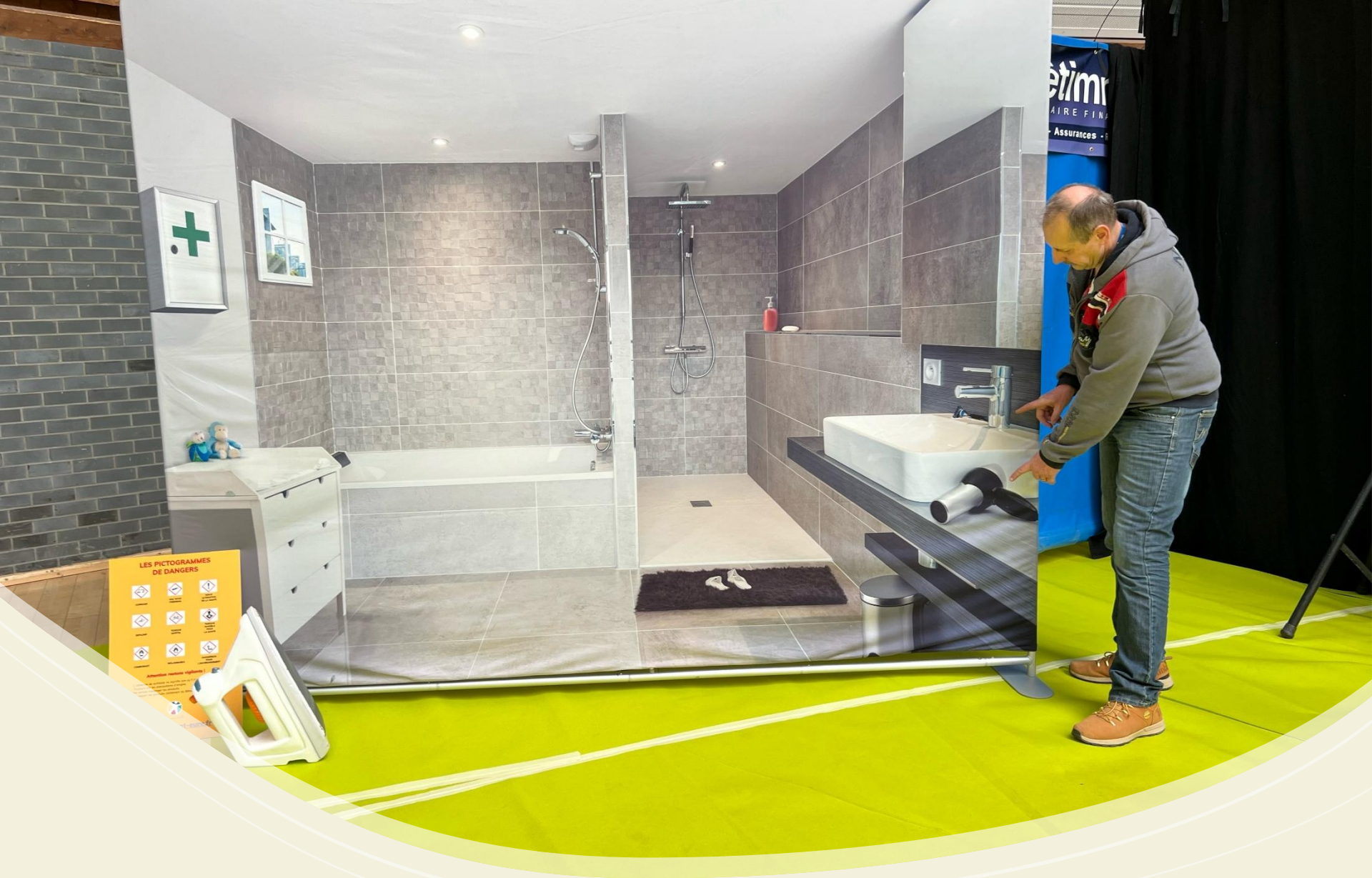
Le décor de la salle de bain